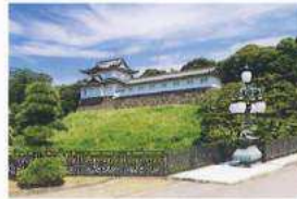
정문절교(니쥬바시)와 후시미야구라(후시미야무루) (지도 ⑩·⑪)

동칭「니쥬바시」로 불리며, 일본국민들에게 익히 알려진 정문절교와 삼대 쇼군 이에미쓰 시절에 교토 후시미성에서 이 전되었다고 전해 내려 오는 후시미야구라. ☎ No.16, No.18