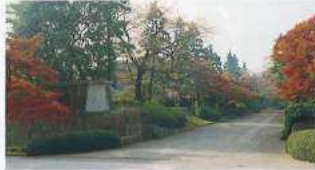
아마시타도오리 (지도 ⑩) ☎ No.24, No.25

동칭「니쥬바시」로 불리며, 일본국민들에게 익히 알려진 정문절교와 삼대 쇼군 이에미쓰 시절에 교토 후시미성에서 이 전되었다고 전해 내려 오는 후시미야구라. ☎ No.16, No.18