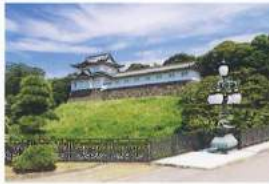
정문철교(니쥬바시)와 후시미야구라(후시미망루) (지도 ⑨·⑩)

동경「니쥬바시」로 불리며, 일본국민들에게 익히 알려진 정문철교와 삼대 쇼군 이에미쓰 시절에 고토 후시미성에서 이 전되었다고 전해 내려 오는 후시미야구라. ☞ No.16, No.18