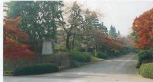
아마시타도오리 (지도 ⑪) ☞ No.24, No.25

동경「니쥬바시」로 불리며, 일본국민들에게 익히 알려진 정문철교와 삼대 쇼군 이에미쓰 시절에 고토 후시미성에서 이 전되었다고 전해 내려 오는 후시미야구라. ☞ No.16, No.18