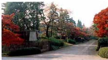
山下大道（地图11） 📍 No.24, No.25

这里被通称为‘二重桥’，有着日本国民所熟知的正门铁桥和据说是在三代将军家光时期从京都·伏见城迁移过来的伏见櫓。📍 No.16, No.18